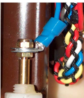
Reparatur und Austausch