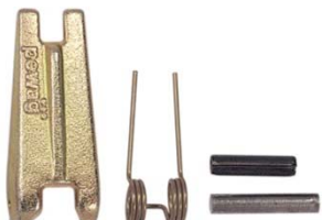
Ersatzteile für (fast) jede Marke