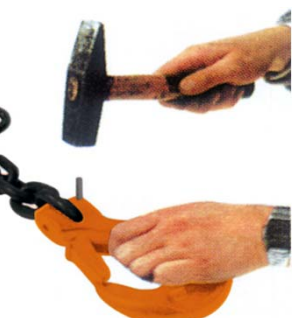
Ersatz defekter Teile