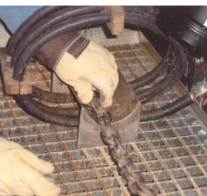
Zerstörungsfrei Prüfen (Fluxen)