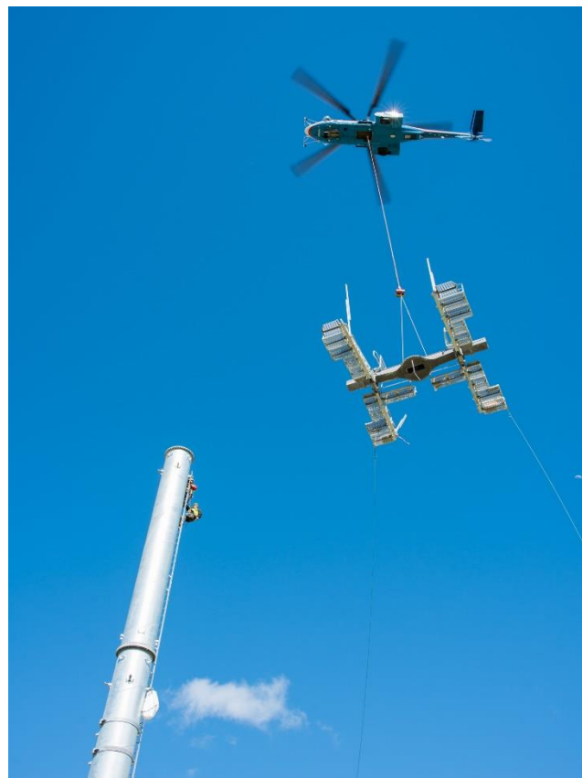
Abb. 2: Airbus H225, aiRtelis France mit TLL_50_30 (WLL 50 kN)