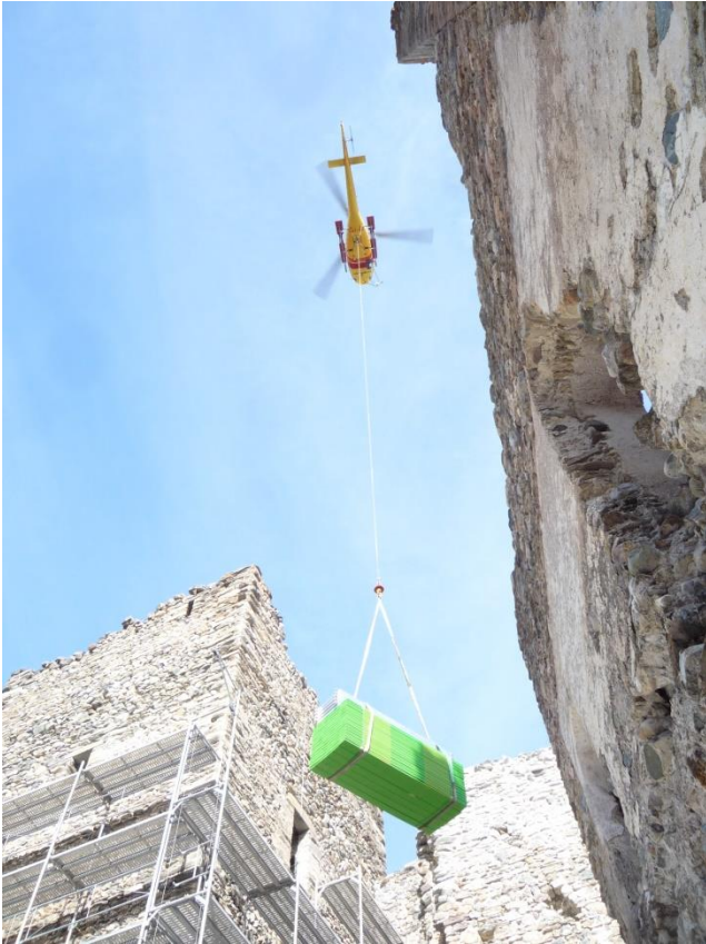
Abb.3: AS 350B3e Heli Bernina AG mit TLDS+_14_30 (WLL 14 kN).