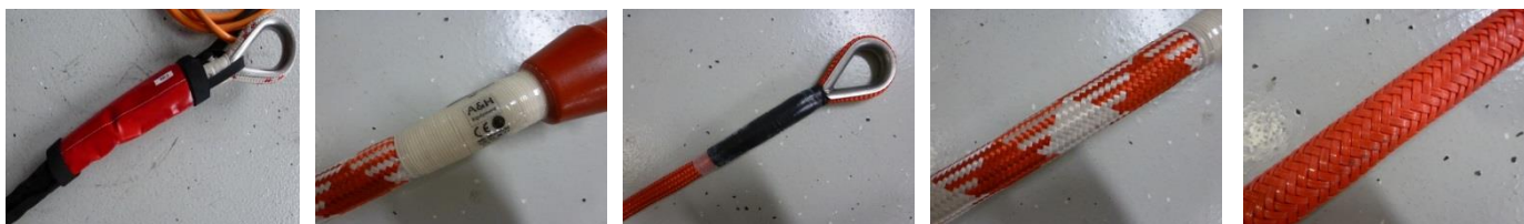
Abb. 5 – 9: diverse Endhalter und Seilmäntel

Link: Datenblatt Dyneema ® > www.air-work.swiss , Bibliothek & Geschichte