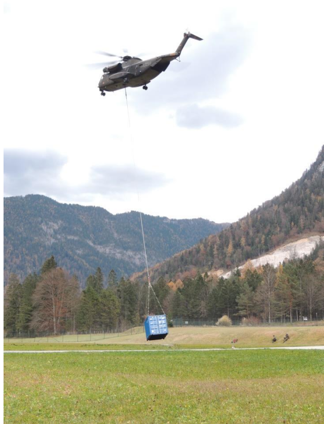
Abb. 1: CH-53 der Heeresflieger mit Leine TLM_90_30 (WLL 90 kN).