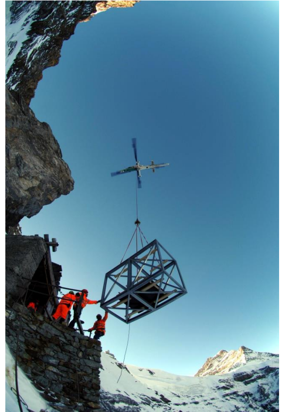
Abb. 4: KAMAN K-1200 "K-MAX" mit TLP_55_30 (WLL 30 kN). MFG SBV