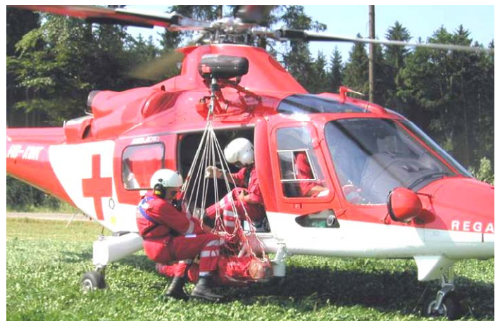
Posizione a terra