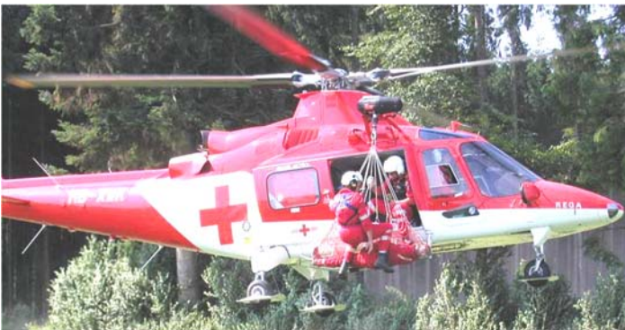
Posizione in volo

Nel caso e durante le procedure di emergenza invece non si può escludere che avvenga un contatto col suolo, vista la compressione del carrello nonché lo stiramento strutturale della rete ed il piegamento del corpo.